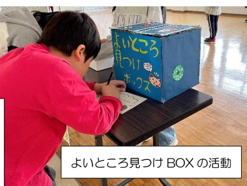
よいところ見つけBOXの活動