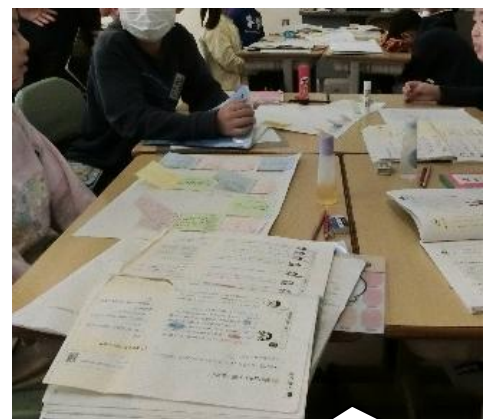
3年生 意見を分類する様子

今後大切になっていく多様な学びに向けて、これからの時代を生き抜いていくために必要な資質・能力を伸ばし「何を学ぶか」から「どのようにして学ぶか」そして将来「何ができるようになるか」、こうした子どもたち一人一人の成長を見据え、自己有用感を高められるように、教職員一同で共通理解して取り組んでいくことが重要と考えています。来年度も、駒場小学校児童の表現力の育成や学力の向上を目指して研修を進めてまいります。